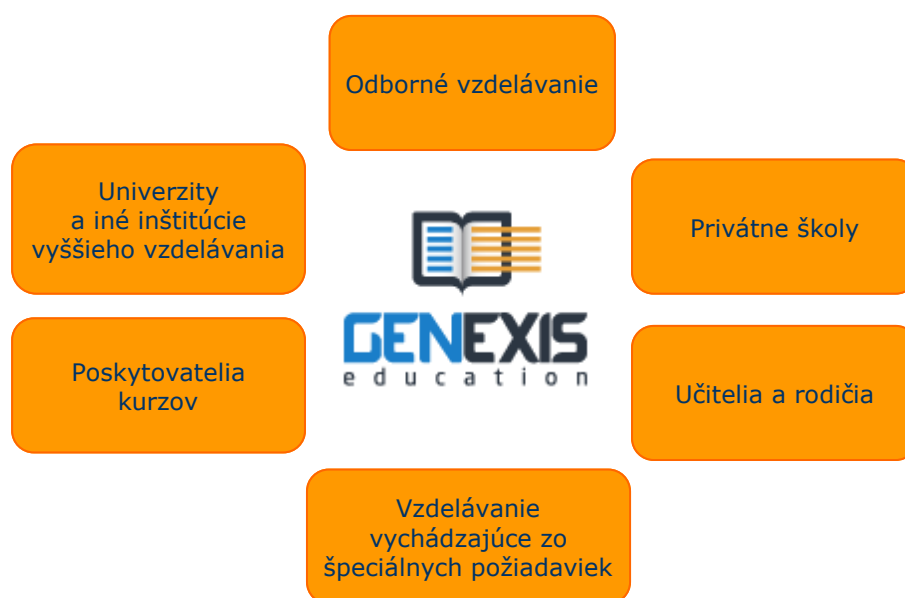
Obr.1: Skupiny užívateľov systému GENEXIS

Poskytovatelia kurzov – GENEXIS predstavuje jednoduchú cestu k sprístupneniu akéhokoľvek kurzu on-line a tým k jeho sprístupneniu väčšiemu počtu potenciálnych záujemcov. Čas a miesto štúdia už nebudú predstavovať problém keďže výučba, testovanie ako aj konzultácie prebiehajú na jednom mieste a tým umožňujú aj lepšiu prípravu na záverečné testovanie.